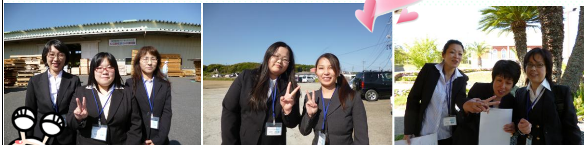
みんな、頑張ってるね!(^^)!

タイピックの事務所でもOA経理科の生徒さんが二人、事務職を体験実習中です。顔を見かけたらどうぞ温かい声をかけてあげてください。