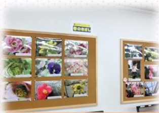
デジカメ講座の作品 も花いっぱい

今、益田教室は春の花色に染まっています。 連日のようにいろいろな生徒さんがお花を持ってきて くださっています。